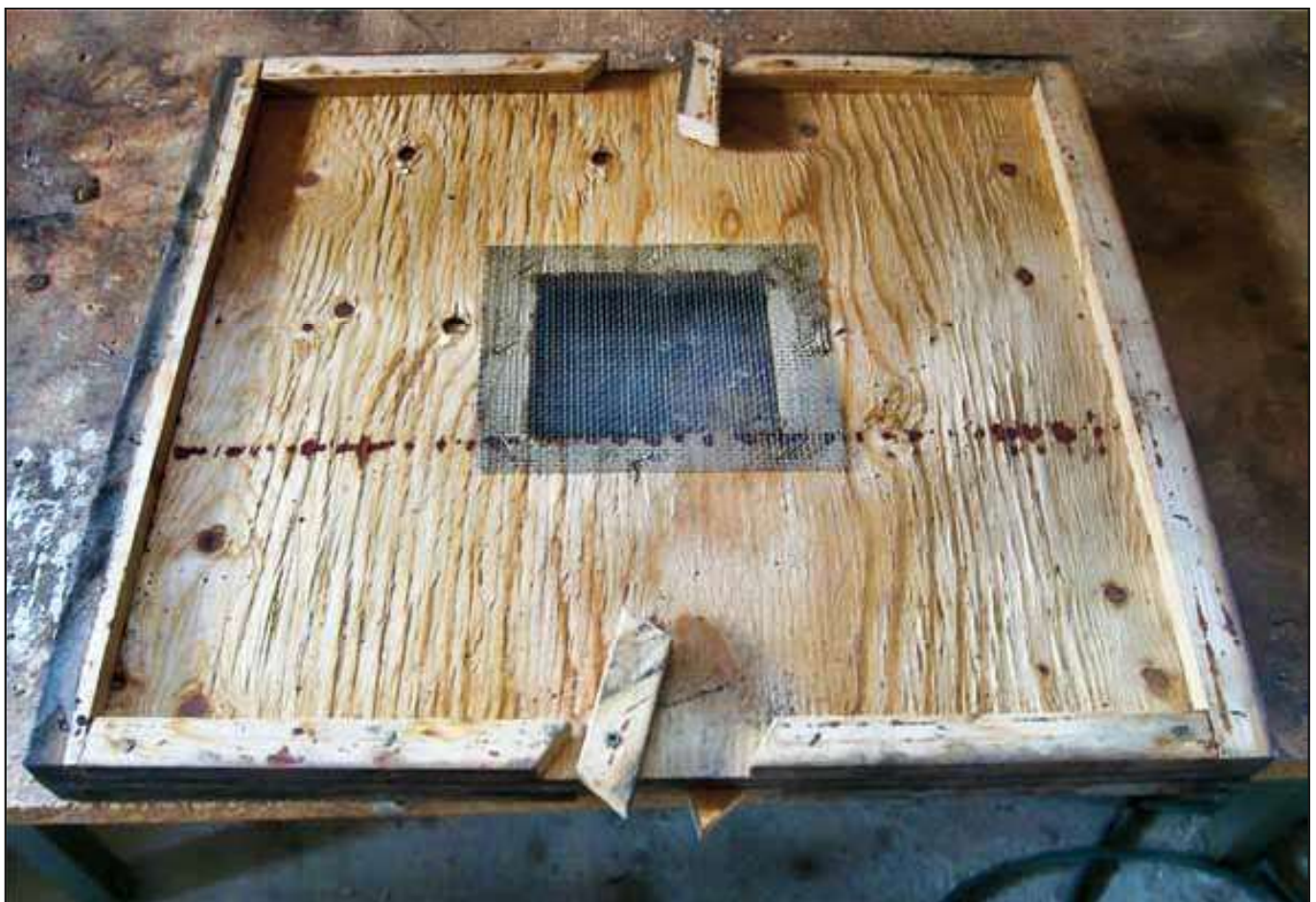
Snelgrovebrädan som jag använder har 4 fluster, 2 på framsidan (som öppnar neråt under brädan respektive uppåt över brädan) och 2 på baksidan. Med dem kan man styra bin från lådor över brädan till lådor under.

Använd ett starkt bisambälle att odla drottningar i.