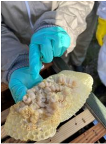
Varroakvalster i drönarutskärningen