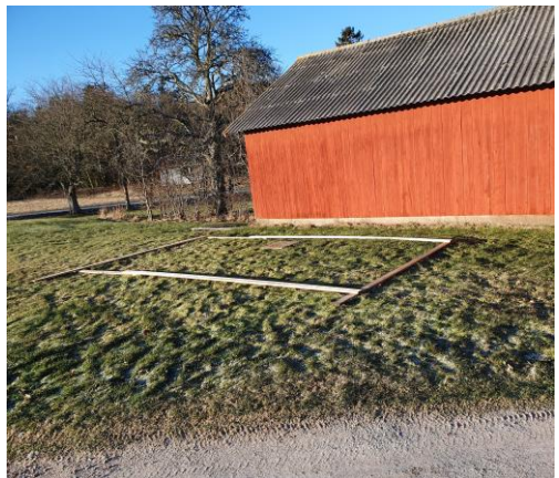
Nya bigårdens placering, Lyr