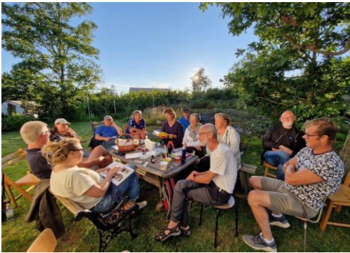
Måndagsträff på bigården i Håv