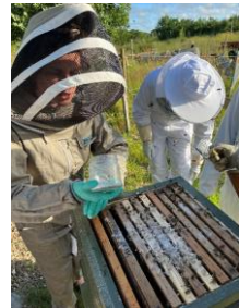
Varroakontroll med hjälp av florsockermetoden.

Det har varit ett år med både med- och motgångar. Det började med några rejäla bakslag då vi vid vårkontrollen upptäckte att två av våra fyra samhällen inte hade klarat vintern. Några veckor senare hade vi en rejäl myrinvasion vilket ledde till att ytterligare ett samhälle gick förlorat. Av det återstående samhället fanns inte så många bin kvar, dock gick där en drottning som tur var. Vi försökte sanera ramarna på myror och flyttade över ramarna och drottningen till en bänk med ny botten och en ny sarg, bänken myrsäkrade vi dels med burkar med vatten i, dels med plast som vi hängde under botten.