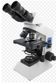
Toupcam - mikroskop kamera inkl. Program.